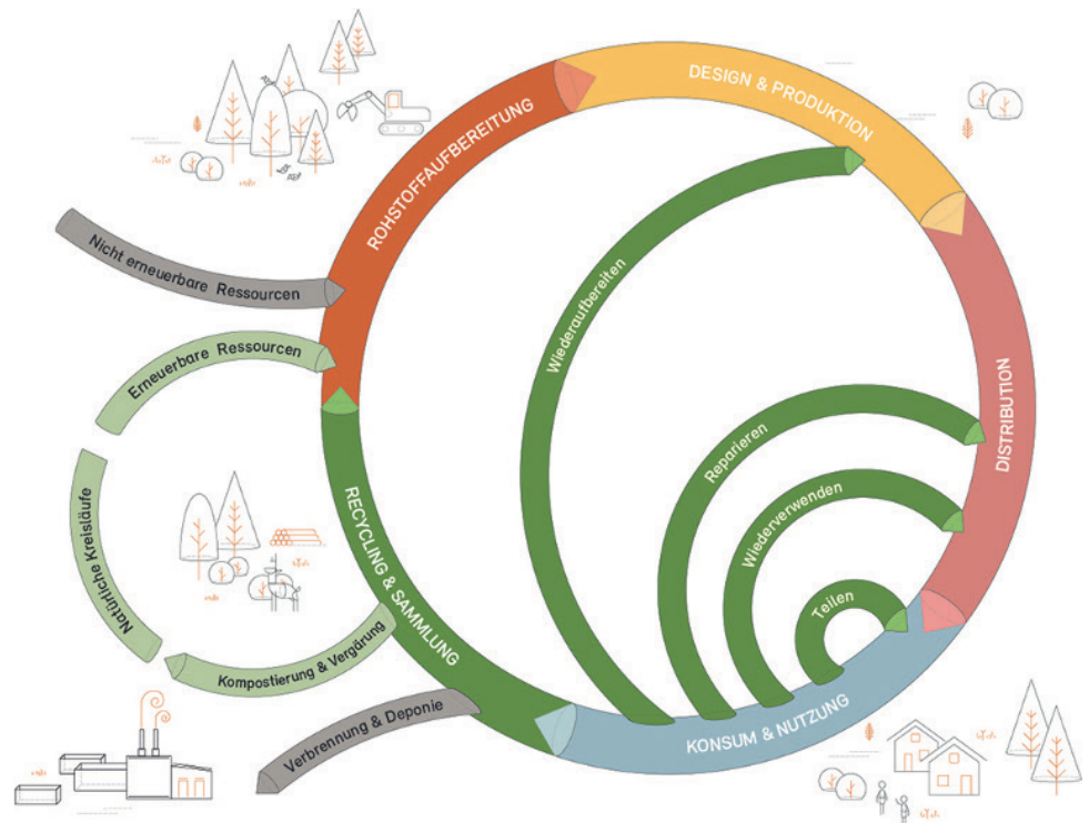
Abbildung 1: Systematische Abbildung der Kreislaufwirtschaft, BAFU

Indem KLW-Kriterien in die Beschaffungsgeschäfte integriert werden, erhalten die Anbietenden den Anreiz, die dafür notwendigen Umstellungen in ihren Betrieben anzugehen. Die öffentliche Hand kann so Anreize für die Transformation vom linearen zum zirkulären Wirtschaftssystem schaffen und mit gutem Vorbild vorangehen.